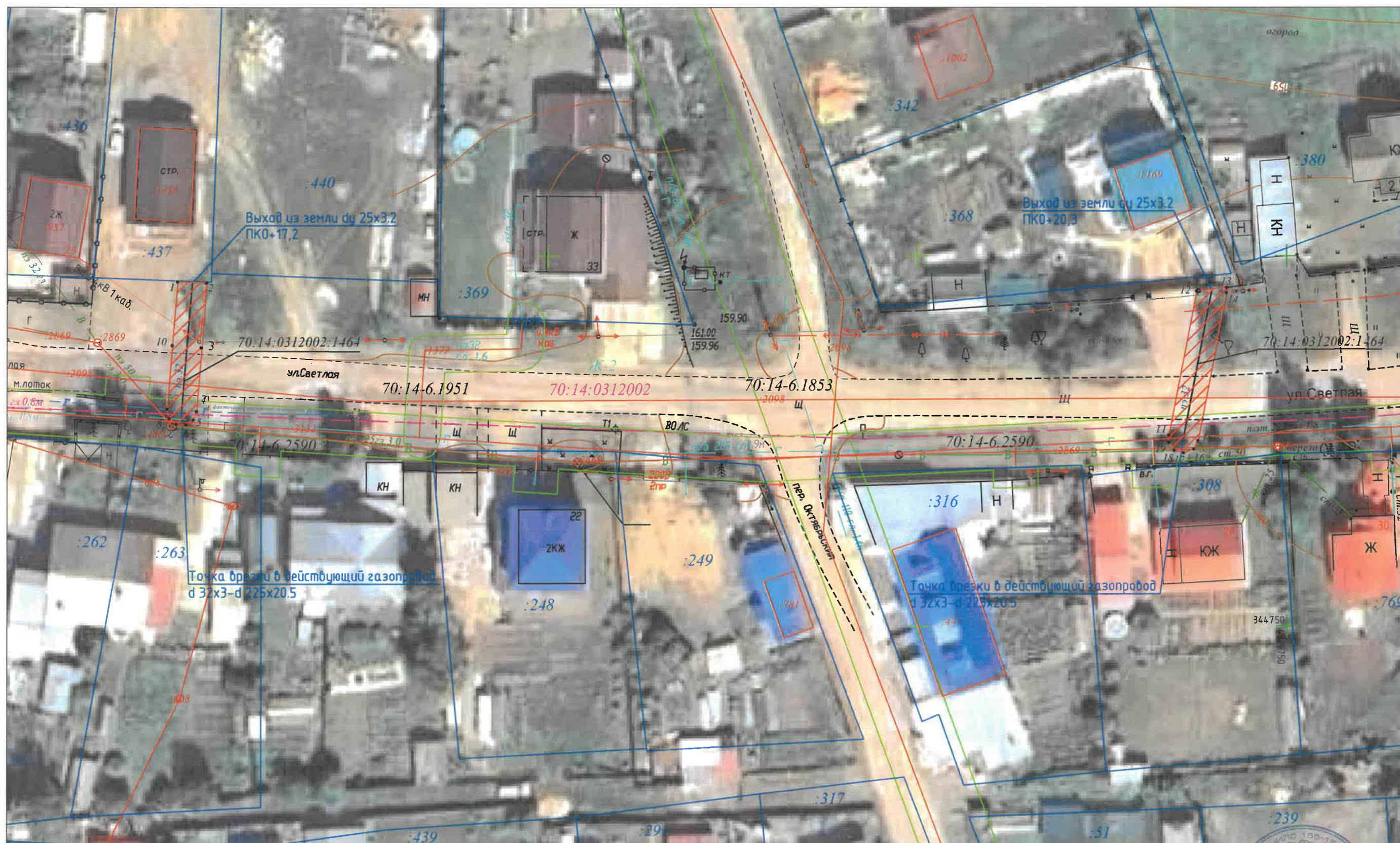
СХЕМА РАСПОЛОЖЕНИЯ ГРАНИЦ ПУБЛИЧНОГО СЕРВИТУТА НА КАДАСТРОВОМ ПЛАНЕ ТЕРРИТОРИИ